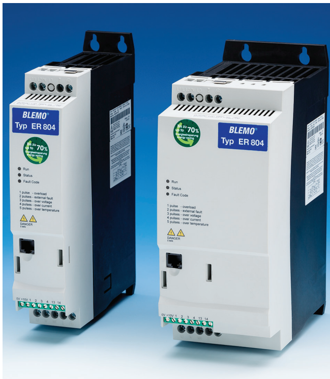
Zwei Baugrößen bis 7,5 kW

Der kinderleichte Frequenzumrichter von BLEMO® – für alle Anwendungen mit Asynchronmotoren